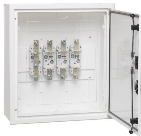
Figura 2 – Equipamento para a Portinhola P400